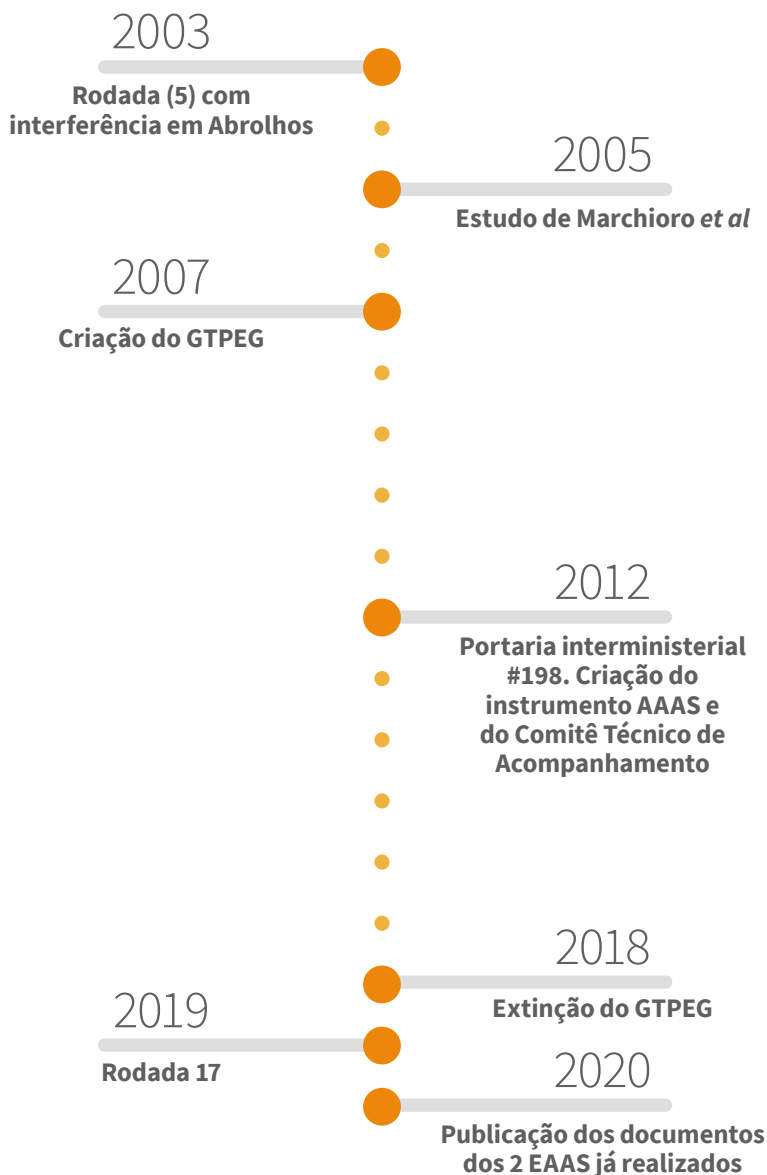
Figura 2. Linha do tempo com principais marcos temporais dos eventos relacionados ao histórico da aplicação da AAAS no Brasil

A mencionada diretriz do CNPE – Resolução no 8 de 21 de julho de 2003 – veio à luz depois de controvérsias em torno da outorga de blocos no banco de Abrolhos, na 5ª rodada, em 2003, que será analisada na seção 3 deste estudo. A incorporação de diretrizes ambientais aos primeiros leilões de blocos era feita mediante simples consulta por ofício da ANP ao Ibama. A Resolução no 8 de 2003, que estabelece a