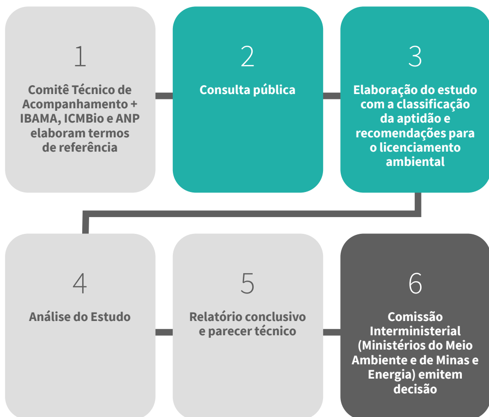
Figura 1. Fluxograma do processo decisório da Avaliação Ambiental de Área Sedimentar (AAAS)

Fonte: Preparado a partir da Portaria Interministerial no. 198 de 5 de abril 2012.